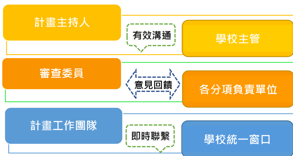
圖 1、專責單位組織架構圖